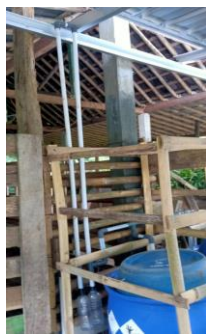
Gambar 1. Digester plastik, penampung biogas dan penyaluran gas ke rumah peternak

Proses Pembuatan digester plastik adalah sebagai berikut : (1) Buat galian tanah ukuran lebar 1 meter, dalam 1 meter panjang 5 meter, (2) Pasang herbel di dalam galian yang sudah dibuat (3) Pasang paralon 4" di inlet dan outlet (4) Pasang plastik untuk digester (5) Pasang instalasi (6) Masukkan kotoran Minimal 10 karung yang sudah di hancurkan campur dengan air 1 : 2 pada bak penampungan sementara / bak pencampur. (7) Masukkan lumpur kotoran tersebut ke dalam biodigester melalui lubang pemasukan (inlet) (8) Mulai hari ke 21 dan seterusnya sudah terbentuk gas methana (CH 4 ) yang dapat digunakan sebagai bahan bakar untuk menyalakan kompor gas. (9) Setiap hari, digester harus selalu diisi lumpur kotoran