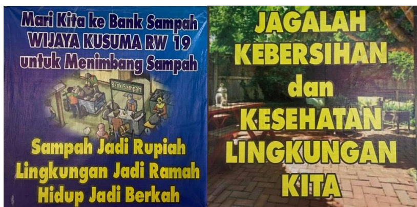
Gambar 3. Pamflet Bank Sampah Wijaya Kusuma, 2025

Bank sampah buka sebulan sekali, diminggu kedua setiap hari Sabtu pagi, pukul 08.00 hingga 11.00 untuk menerima setoran sampah hasil pemilahan dari warga. Sampah-sampah hasil pilahan ini ditimbang dan dibukukan sebagai catatan tabungan yang akan dikonversi dengan harga per kilogram masing-masing jenis sampah, dan per liter untuk minyak jelantah yang disetor.