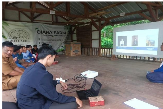
Gambar 3. Kegiatan Sharing Session