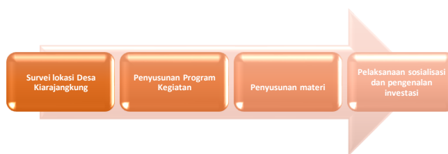
Gambar 1. Tahapan pelaksanaan kegiatan

Berikut tahapan pelaksanaan sosialisasi dan pengenalan investasi yang dilaksanakan di Desa Kiarajungkung, Kecamatan Sukahening, Kabupaten Tasikmalaya