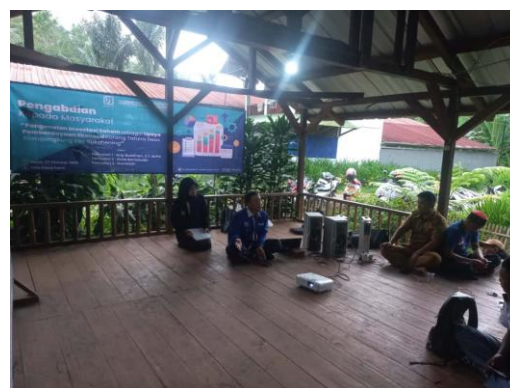
Gambar 5. Penjelasan pertanyaan