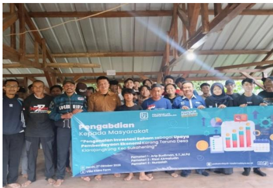
Gambar 2. Tim Pengabdian dan peserta