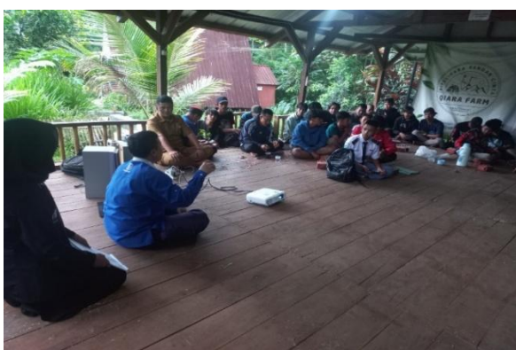
Gambar 4. Sesi tanya jawab