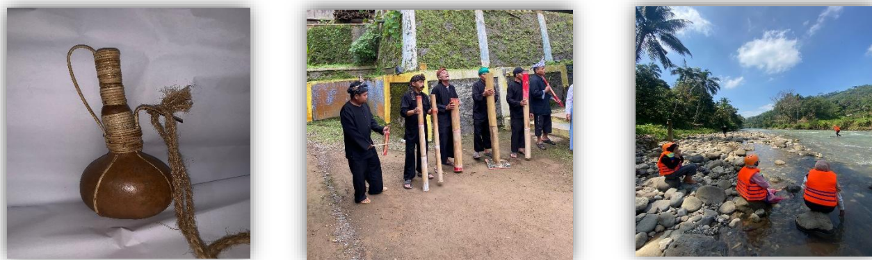
Gambar 3. Kukuk, Lodong Gejlig, dan Ekowisata Cilongan

Secara keseluruhan, kegiatan pengabdian ini meningkatkan pemahaman dan kesadaran masyarakat tentang pentingnya pelestarian budaya dan pengelolaan potensi lokal secara berkelanjutan. Kolaborasi antara mahasiswa, pelaku seni, perajin, dan pengelola wisata menghasilkan dokumentasi visual, narasi tematik, yang dipublikasikan melalui kanal Youtube juga media social lainnya, dan rekomendasi pengembangan yang kini mulai dimanfaatkan oleh pemerintah desa dalam promosi potensi desa. Hasil ini menunjukkan bahwa pendekatan eksploratif-partisipatif mampu memberikan dampak nyata dalam mendukung pengembangan Desa Pusparahayu sebagai desa berbasis budaya dan ekowisata berkelanjutan.