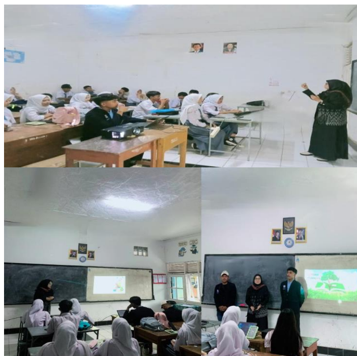
Gambar 1. Pemaparan materi kepada siswa

Selanjutnya, pada sesi diskusi, siswa diajak untuk berbagi pengalaman dalam mengatur uang saku dan mendiskusikan permasalahan keuangan sederhana yang mereka hadapi, seperti sulit menabung atau sering menghabiskan uang untuk hal tidak penting. Sesi ini berlangsung interaktif siswa antusias bertanya dan menanggapi pandangan teman-teman mereka. pameri membantu mengarahkan agar siswa dapat memahami bahwa setiap keputusan finansial yang mereka buat memiliki dampak jangka panjang terhadap kebiasaan keuangan mereka di masa depan.