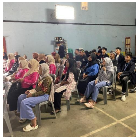
Gambar 2. Penyampaian Materi oleh Narasumber dan Salah Satu Produk UMKM