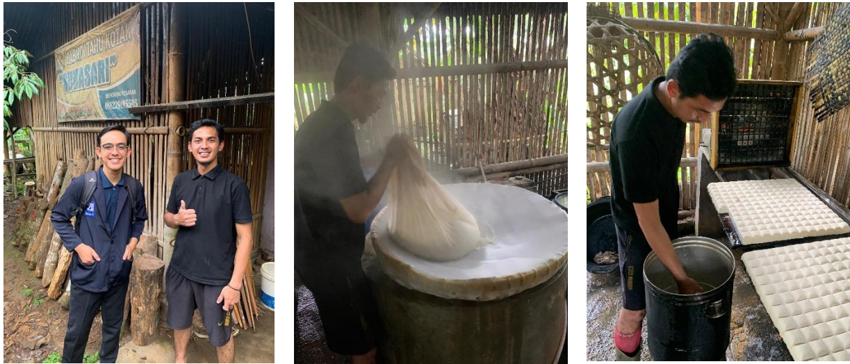
Gambar 1. Lokasi Pabrik Tahu Sukasari

Pelatihan pembuatan laporan keuangan dilakukan secara daring pada tanggal 24 Oktober 2025 pukul 10.00 s.d. selesai. Materi yang disampaikan mencakup pentingnya pembukuan, metode pembukuan, serta langkah-langkah pembuatan laporan keuangan.