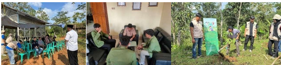
Gambar 5 Program Kerja Bidang Lingkungan

Kesimpulannya, kegiatan lingkungan di Desa Sukarasa tidak sekadar menghasilkan dampak fisik berupa penghijauan atau pengurangan limbah, tetapi juga membangun transformasi sosial-ekologis yang selaras dengan prinsip pembangunan berkelanjutan. Pendekatan kolaboratif antara masyarakat dan perguruan tinggi telah mendorong tumbuhnya perilaku pro-lingkungan yang berkelanjutan, sesuai dengan nilai-nilai environmental citizenship dan komitmen terhadap aksi iklim lokal dalam kerangka SDG's 13.