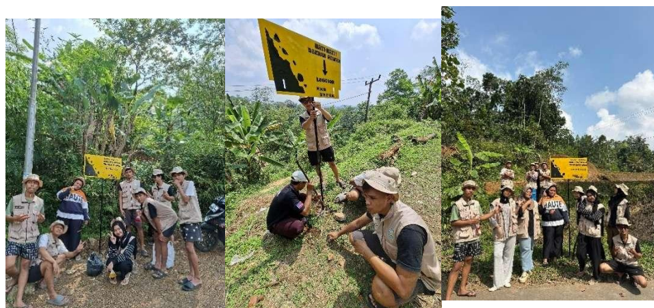
Gambar 6 Program Kerja Mitigasi Bencana

menjadi elemen penting dalam memperkuat resiliensi desa. Dengan demikian, pelibatan masyarakat Sukarasa tidak hanya memperkuat kesiapsiagaan, tetapi juga menghidupkan kembali kearifan lokal sebagai modal sosial untuk membangun ketahanan berbasis budaya dan lingkungan.