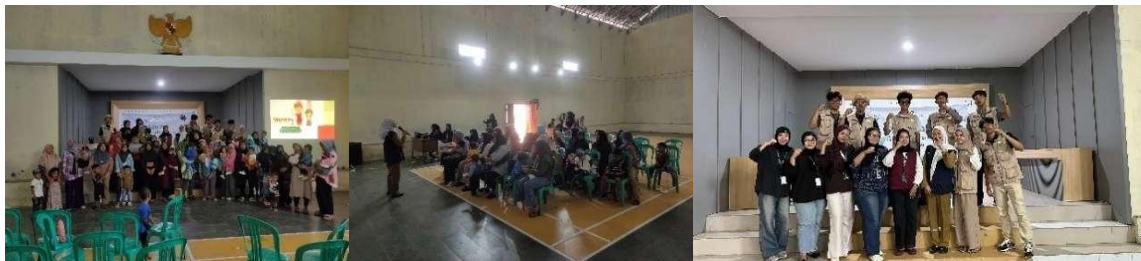
Gambar 3 Program Kerja Bidang Kesehatan

Kegiatan kesehatan di Desa Sukarasa tidak hanya menumbuhkan kesadaran individual, tetapi juga memperkuat kapasitas sosial masyarakat dalam menjaga kesehatan keluarga. Kolaborasi antara tenaga kesehatan, kader, dan masyarakat menjadi fondasi penting untuk mewujudkan desa sehat dan berketahanan gizi secara berkelanjutan.