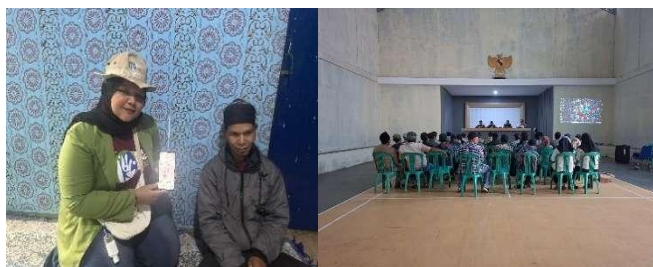
Gambar 6 Program Kerja Bidang Kelembagaan

dukungan lokal. Ketiga, kapasitas teknis aparat desa bertambah melalui pelatihan administrasi dan manajemen keuangan sehingga tata kelola operasional menjadi lebih adaptif terhadap kebutuhan UMKM. Semua efek ini selaras dengan sasaran SDG 8 mendorong pertumbuhan ekonomi inklusif dan kesempatan kerja layak di level lokal karena kebijakan berbasis data dan partisipasi memperbesar peluang dukungan bagi usaha mikro dan penciptaan pekerjaan setempat. Hasil ini konsisten dengan kajian empiris tentang collaborative governance dan peran perguruan tinggi dalam penguatan kapasitas desa. Studi-studi lapangan di Indonesia menunjukkan bahwa kemitraan antara universitas dan pemerintah desa (sering disebut model university–community engagement atau bentuk pentahelix/quadruple helix lokal) meningkatkan efektivitas program pemberdayaan, mempercepat adopsi inovasi, dan memperkuat tata kelola desa jika pengabdian dirancang sebagai kemitraan jangka panjang, bukan intervensi satu kali (Islamy & Andriany, 2022; Novita et al., 2024). Selain itu, analisis lebih luas tentang tata kelola desa dan partisipasi publik menegaskan bahwa kebijakan desa yang memberdayakan masyarakat dan mendukung transparansi cenderung menghasilkan pembangunan lokal yang lebih inklusif dan berkelanjutan (World Bank, 2023).