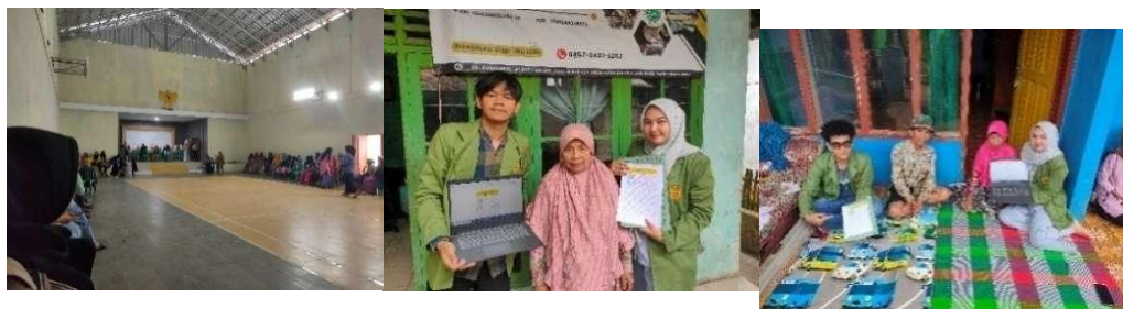
Gambar 4 Program Kerja Bidang Kesehatan

Dapat dikatakan bahwa kegiatan bidang ekonomi di Desa Sukarasa tidak sekadar menambah wawasan keuangan, tetapi juga membangun ekosistem ekonomi mikro berbasis kolaborasi dan literasi finansial, selaras dengan tujuan SDG 8 untuk menciptakan pertumbuhan ekonomi inklusif dan kerja layak bagi semua.