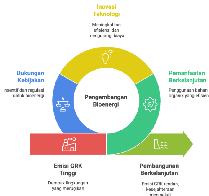
Gambar 1. Contoh ilustrasi Pengembangan Bioenergi (Penulis, 2025)

ketidakefektifan teknologi yang terkait dengan insentif kebijakan (Arifan dkk., 2021; Budiman, 2021). Pengembangan bioenergi tidak hanya berkontribusi dalam mengurangi emisi gas rumah kaca tetapi juga sejalan dengan pencapaian Tujuan Pembangunan Berkelanjutan (SDGs), khususnya SDG 7 (Energi Bersih dan Terjangkau), SDG 9 (Inovasi dan Infrastruktur), dan SDG 13 (Aksi terhadap Perubahan Iklim) (ŞENOL, 2020). Misalnya, pemanfaatan limbah pertanian untuk biogas terbukti mampu mengurangi emisi karbon meskipun angka spesifik bervariasi tergantung pada jenis biomassa yang digunakan (Dhungana dkk., 2022; Tamburini dkk., 2020). Bioenergi lokal, seperti biogas yang dihasilkan dari limbah ternak, mendukung penguatan ekonomi desa, menciptakan lapangan kerja, serta menurunkan biaya energi rumah tangga (Arifan dkk., 2021; Lwiza dkk., 2017).