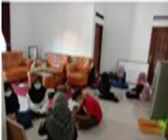
Gambar 1. Proses belajar di Site 3 dan Site 4