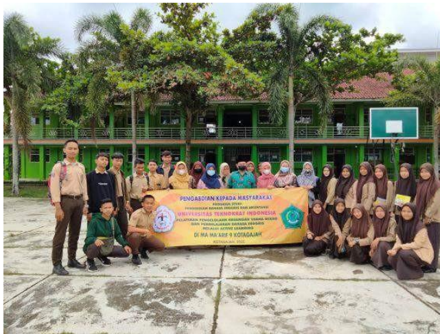
Gambar Foto Bersama dengan tim yang terlibat kegiatan PkM