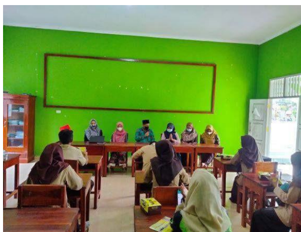
Gambar Penutupan Kegiatan PkM

Kegiatan PkM diakhiri dengan pemberian Doorprize bagi 3 peserta terbaik yang dapat menjawab pertanyaan oleh masing-masing pemateri. Selanjutnya, kegiatan dilanjutkan dengan pengisian kuesioner melalui Google Forms. Diakhir, kegiatan ditutup dengan penutupan yang dihadiri oleh Kepala sekolah serta foto bersama dengan seluruh tim yang terlibat.