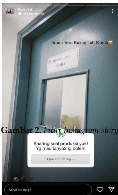
Gambar 2. Fitur Instagram story

media perusahaan. Pihak pengelola akun Instagram @pakolescom dapat menggunakan fitur Instagram Ads yang