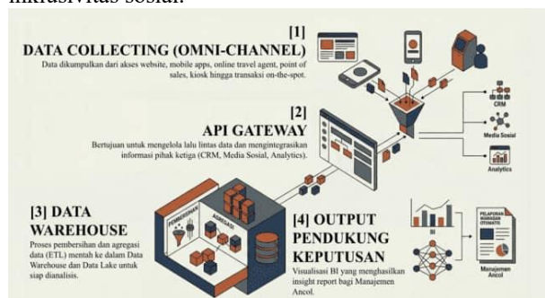
Gambar 2. Alur dan Arsitektur Data Ancol

Data yang telah terintegrasi kemudian diproses melalui tahapan ETL ( extract, transform, load ) untuk disimpan secara terstruktur di dalam data warehouse dan data lake . Fondasi data yang solid ini memungkinkan tahap akhir berupa pemrosesan output pendukung keputusan melalui business intelligence (BI) yang menghasilkan pelaporan wawasan otomatis. Infrastruktur teknologi informasi ini memastikan bahwa setiap kebijakan operasional yang diambil memiliki landasan faktual yang presisi. Berdasarkan arsitektur data tersebut, analisis hasil penelitian ini akan ditinjau melalui tiga dimensi utama, yaitu efisiensi ekonomi operasional, dampak lingkungan berkelanjutan, serta inklusivitas sosial.